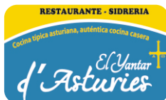
El Yantar D'Asturies