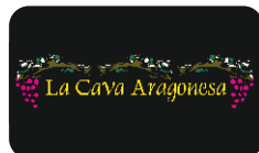
La Cava Aragonesa