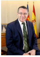
TONI PÉREZ ALCALDE DE BENIDORM MAYOR OF BENIDORM

El patrimonio gastronómico de Benidorm es, cada año con más fuerza, un valor añadido a nuestra oferta turística, que consolida el éxito de nuestra ciudad a nivel nacional e internacional. Los restauradores de Benidorm apuestan con ánimo por una oferta de calidad y de producto, que además de suponer un atractivo para quienes nos visitan también satisface los paladares de las gentes que vivimos aquí.